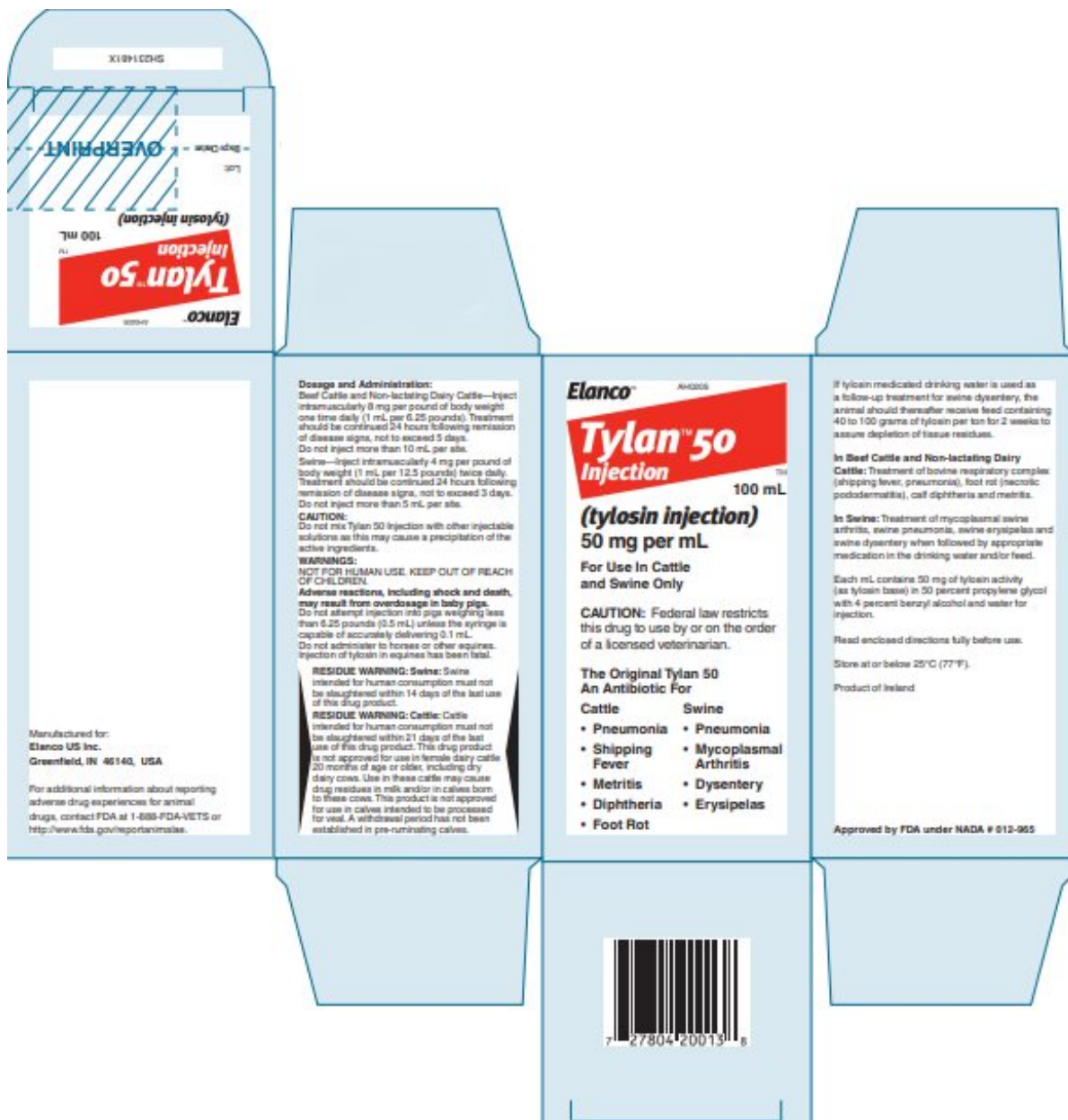
Principal Display Panel - Tylan 50 Injection Package Insert Label