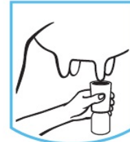
Teat Dip Baño de tetina

KEEP OUT OF REACH OF CHILDREN | MANTÉNGASE FUERA DEL ALCANCE DE LOS NIÑOS FOR INDUSTRIAL USE ONLY - NOT FOR HOUSEHOLD USE | PARA USO INDUSTRIAL SOLAMENTE - NO ES PARA USO DOMESTICO NOT FOR HUMAN USE. | NO ES PARA USO HUMANO.