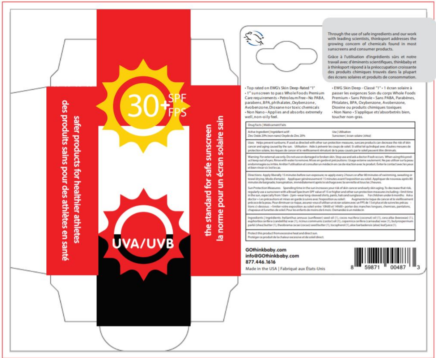
Unit Carton Photo 2 of 2